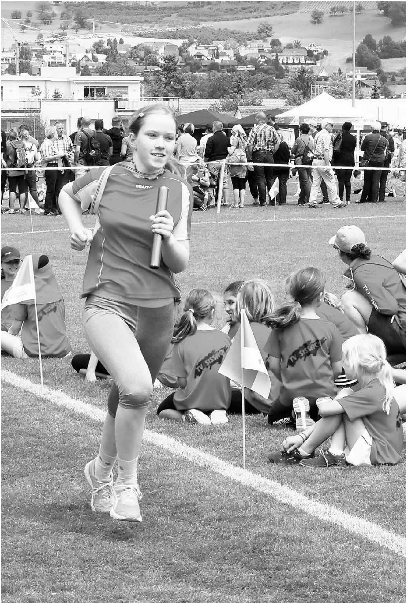
Pendelstafette am Kantonalen Jugendturnfest 2018 in Sissach.